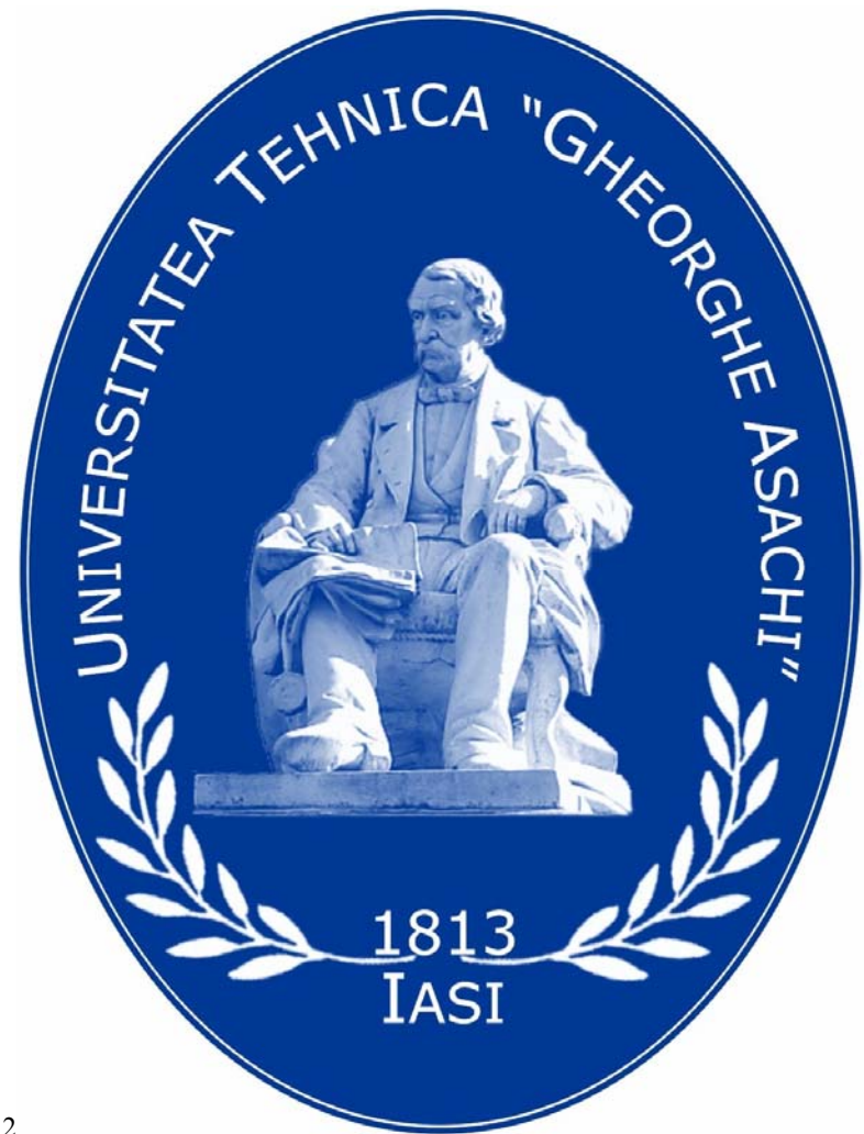
Forma 1 Forma 2