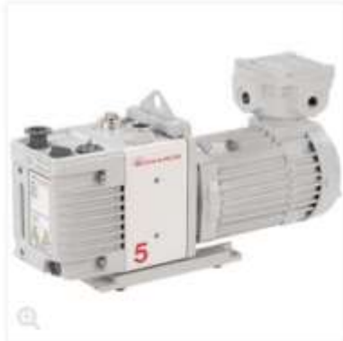
Representative image only.