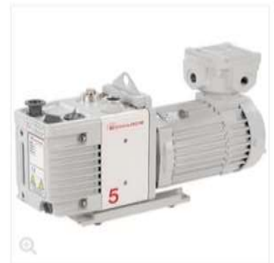
Representative image only.

Home | Pumps | Vacuum Pumps | Edwards™ RV Series Rotary Vane Va Edwards RV5 Two Stage Rotary Vane Pump; 200 to 220/380 to 415 V, 50 380/460 V)